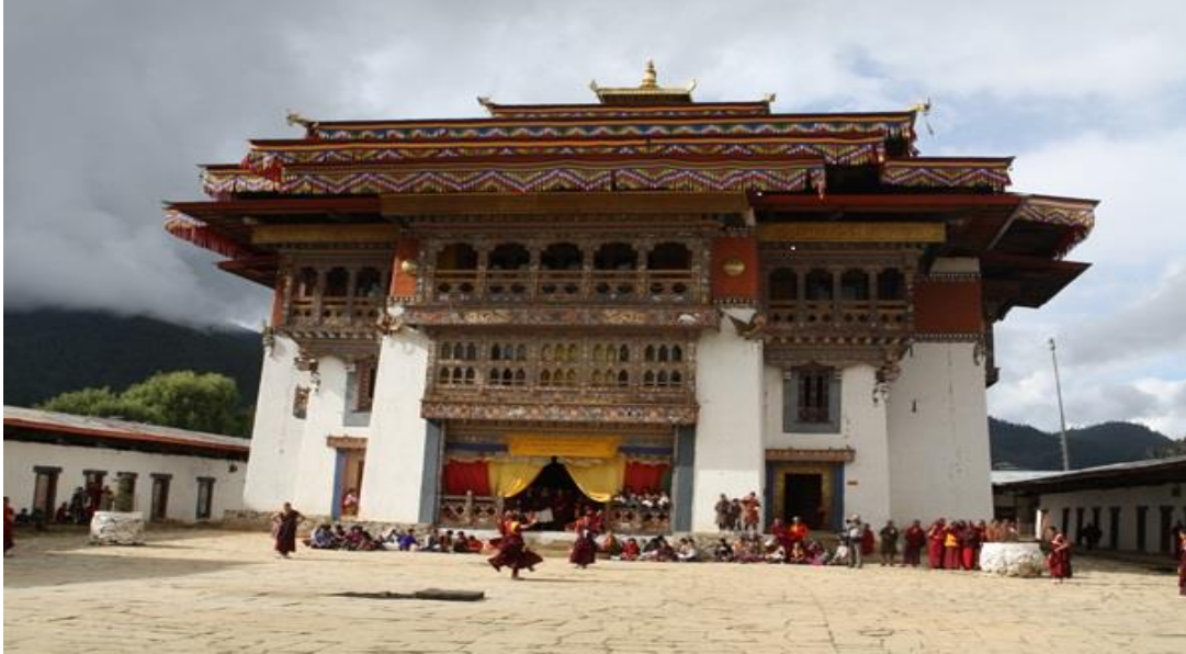
Gangtey è l'unico

monastero dei Nyingmapa sul lato occidentale della valle, e il più grande monastero Nyingmapa in Bhutan. Il monastero è circondato da un villaggio abitato dalle famiglie dei 140 Gomchen che si occupano dello stesso.